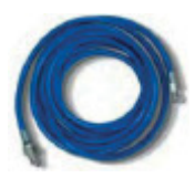
Blue Outlet Hose [S.25M-S.25F] (5m - HS-01-03-05-06-06) (10m - HS-01-03-10-06-06)