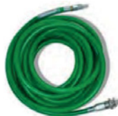
Green Outlet Hose [S.25M-S.25F] (5m - HS-01-02-05-06-07) (10m - HS-01-02-10-06-07)