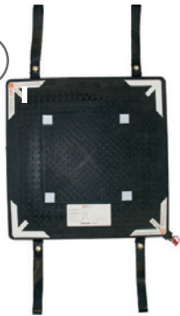
Stak Jak (Größe aus Tabelle auswählen)