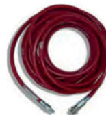
Red Outlet Hose [S.25M-S.25F] (5m - HS-01-01-05-06-07) (10m - HS-01-01-10-06-07)