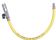
Hochdruck-Ab- sperrschlauch (SP0154)

Der zwischen dem Hebesack (4) und dem Auslassschlauch (b, c oder d) eingefügte 0.5 m lange gelbe Absperrschlauch ist mit einem Kugelventil ausgestattet, das es dem Bediener ermöglicht, den Hebesack gefüllt zu lassen und den Auslassschlauch abzukuppeln.