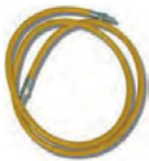
Inlet Hose [T.26M - T.26M] (2m - HS-01-04-02-06-06) (5m - HS-01-04-05-06-06) (10m - HS-01-04-10-06-06)